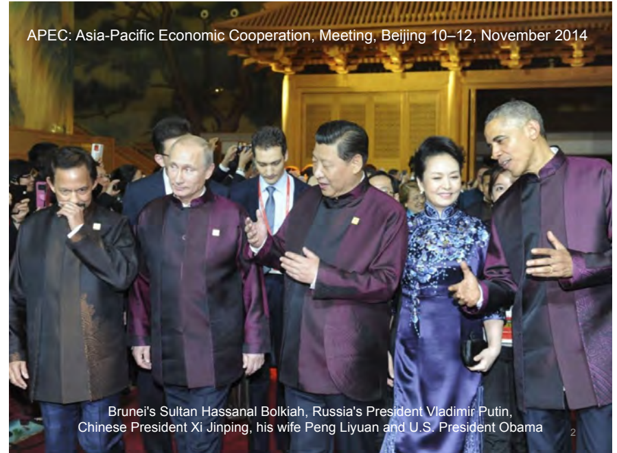
APEC: Asia-Pacific Economic Cooperation, Meeting, Beijing 10–12, November 2014