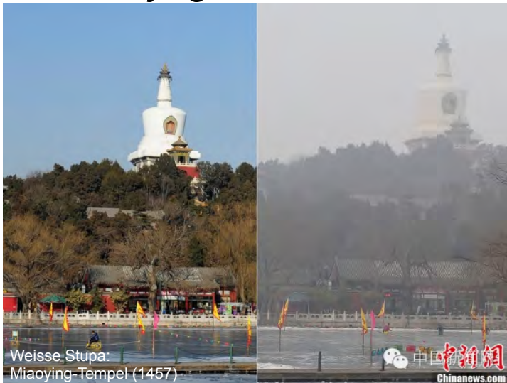
Weisse Stupa: Miaoying-Tempel (1457)