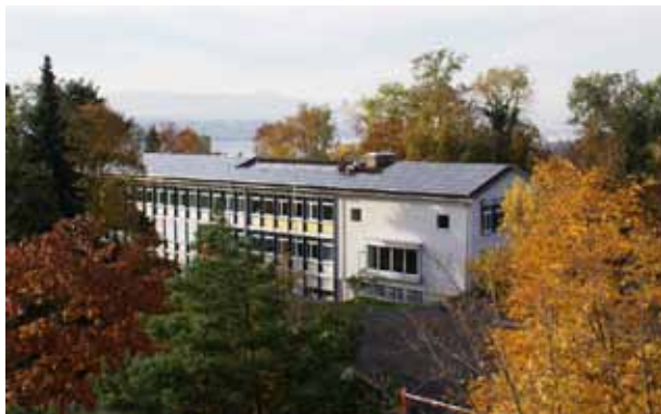
32.375 kWp-PV-Anlage Oberer Hitzberg 1

Die Zürichsee Solarstrom AG (ZSSAG) als Eigentümerin der Anlagen hat die Anlagen finanziert und ist für den störungsfreien Betrieb in den nächsten mindestens 25 Jahren voraussichtlicher Lebensdauer der Anlagen verantwortlich. Eingesetzt wurden für alle Anlagen Solarmodule vom Typ Kyocera KD185GH-2PU mit einer Nennleistung von 185 Wp STC und Wechselrichter der Schweizer Firma Sputnik Engineering AG. Die Module des japanischen Herstellers werden in Europa gefertigt.