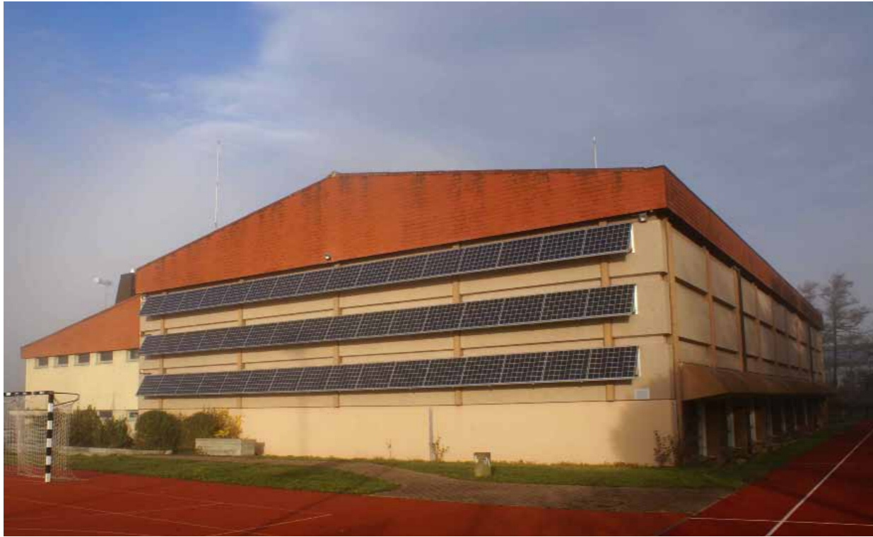
8.88 kWp PV Anlage Fassade Sporthalle Allmendli