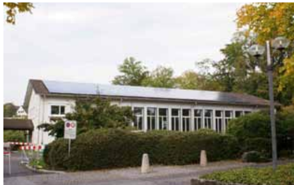
31.08 kWp-PV-Anlage Oberer Hitzberg 3

Die PV Anlage Oberer Hitzberg (OH) besteht aus 3 Teilanlagen: Auf der Turnhalle Oberer Hitzberg die 31.08 kWp Anlage Hitzberg 3, auf dem Schulhaus Oberer Hitzberg die Anlagen Hitzberg 1 mit einer Nennleistung von 32.375 kWp und Hitzberg 2 mit 10.915 kWp. Alle 3 Anlagen speisen den produzierten Solarstrom auf einen gemeinsamen Einspeisepunkt im Schulhaus Oberen Hitzberg ein. Auf dem Schulhaus Oberer Hitzberg ist zudem eine solarthermische Anlage installiert für die Warmwasser Aufbereitung.